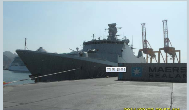
•무스캇 항에 정박중인 최영함