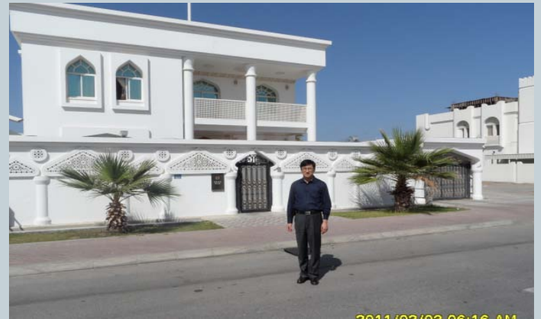
•오만 대한민국 대사관